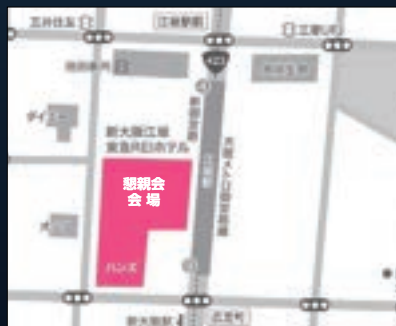
懇親会会場 江坂東急 REI ホテル 〒564-0051 大阪府吹田市豊津町9-6